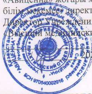
ГРАФИК ПРОХОЖДЕНИЯ ПРОИЗВОДСТВЕННОГО ОБУЧЕНИЯ СТУДЕНТОВ УЧРЕЖДЕНИЯ ОБРАЗОВАНИЯ ВЫСШЕГО МЕДИЦИНСКОГО КОЛЛЕДЖА "АВИЦЕННА" 1 ПОЛУГОДИЕ 2023-24 УЧЕБНЫЙ ГОД